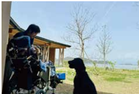
米子市の中海に面した建物