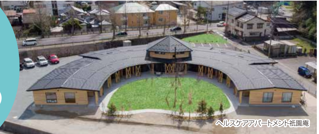
ヘルスケアアパートメント祇園庵